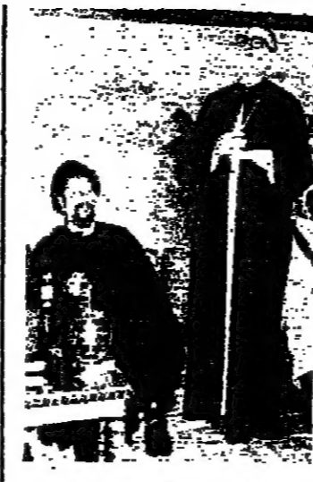
المران الزغبى يلقي كلمته ويبدو امام المصير

يتشاكلين على المحنة المصرية وهي تهدد وقتنا ثعب ونوجهها ايادي سود تعرفها او تجهلها تقرب منا كسبي تقريبا اذا ارادت او اذا ارادوا...! 3 .. ايدا . بعد الازم ، سوف لا نندفد عندما نرى قتالنا او موقفا بالقرب منا وبشمل الفتنة وبغير الازمة بحلهم ولكن بكل ما فيه يحكم وينفذ الحكم . سوف نمر على فتح المحلات ، على التجول في الشوارع ، على التفتت بين الاحياء ولا نحاول الاحتفاظ بحياتنا كما حصل سابقا ، وننتصر للشوارع مقرة والمحلات مسبوقة والربح مسيطرا على البلاد . ان ممارسة الحياة العادية في هذه الظروف واجب وطني بل دفاع عن الوطن وجهاد لخدمة المواطن . سوف نتكاتف للقوات المسلحة التي بدأ بعض المواطنين بها مشكورين ، كتفيا لكي تشمل رجال الدين ، المثقفين ، العمال ، الطلاب ، النساء ، المصانع ، المؤسسات الثقافية والاجتماعية ، البلديات ، رجال الاعمال ، الملقين المحظوظة ، ممالي الاحياء حتى نخرس اصوات المدافع في نيمات المحنة والتعاون والتربية . مظاهرات بالمناطق القبلية سوف تقوم بمظاهرات من المناطق القبلية حيث الحرمان من كل شيء الا من الوطنية والتفاني ، مظاهرات سلمية من المناطق اللبنانية التي تتخاض على الوحدة الوطنية وتنسق مع الحكومة الفلسطينية ، اننا نندعو بكل اخلاص الذين يضمون المواقف التي طريق تشكل الحكومة الكارمية لان يتكروا بمصلحة الوطن قسبل ان يتكروا بمصالحهم ويخونوا المغانم . وقال : نحن لا نعتبر ان الرئيس كرامي هو المسؤول عن تخريف كرامتنا ، واننا نعتبر ان الحل العسكري يصح في الحل الاكبر رجحانا وقد تطورت الامر الى حرب اهلية . ونابع : نحن الان امام نوصية ذهبية موهبا ايام ، فلا لم نندفد منها واعتذر الرئيس كرامي لسيكون في